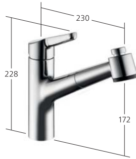
Hebelmischer – Effizienzklasse C – Auszugbrause mit KWC jetclean – bis 700 mm ausziehbar – Rückstellautomatik – Schlauchoberfläche passend zu Armatureoberfläche – Schlauchdurchführung, schwenkbar 130° 10.331.033.000FL chromeline A 230 Auslaufmenge Normalstrahl 11 l/min (3 bar) Auslaufmenge Siebstrahl 11 l/min (3 bar)