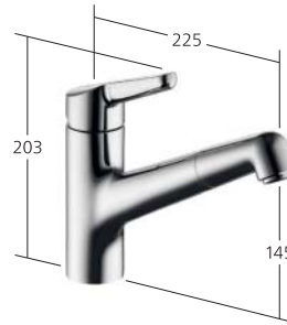
Hebelmischer – Effizienzklasse C – Auszugauslauf – Neoperl® Cascade® – bis 700 mm ausziehbar – Schlauchoberfläche passend zu Armatureoberfläche – Schlauchdurchführung, schwenkbar 130° 10.331.103.000FL chromeline A 225 Auslaufmenge 12 l/min (3 bar)