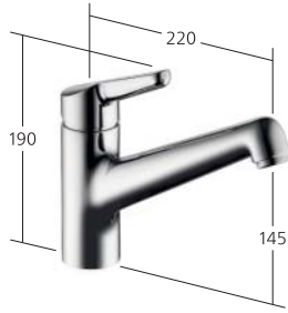
Hebelmischer – Effizienzklasse C – Schwenkauslauf 160° 10.331.023.000FL chromeline A 220 Auslaufmenge 12 l/min (3 bar)